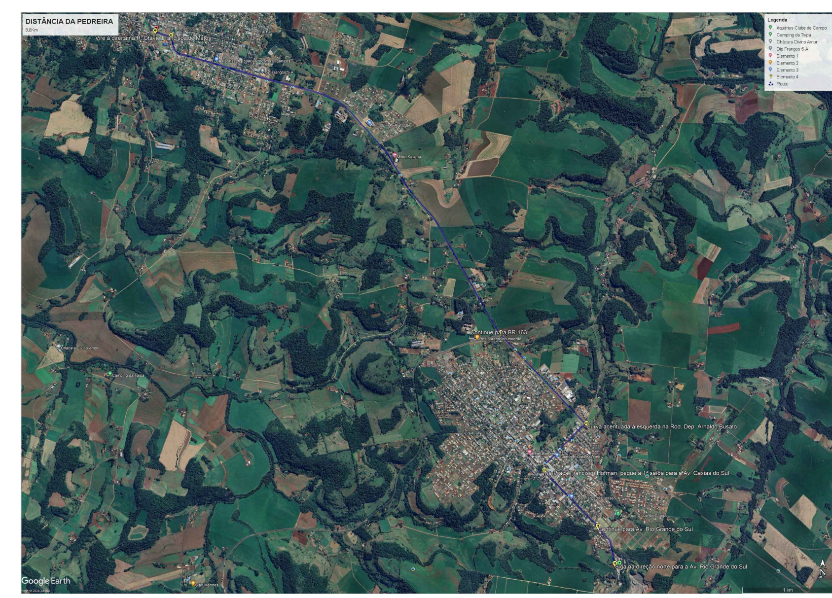
DISTÂNCIA FIXA DA PEDREIRA AO INÍCIO DO TRECHO 8,8Km